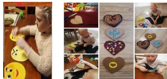
„Zuikių“ projektiniai darbai