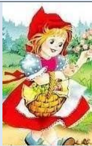
Mūs vaikystės mergaitė...

tėms, konkursams, parodoms, bet sukviesti rajono bei respublikos ikimokyklinių įstaigų folkloro kolektyvus dalyvauti įstaigos organizuojamame folkloro festivalyje „Virš marių saulelė, o širdy – giesmelė“.